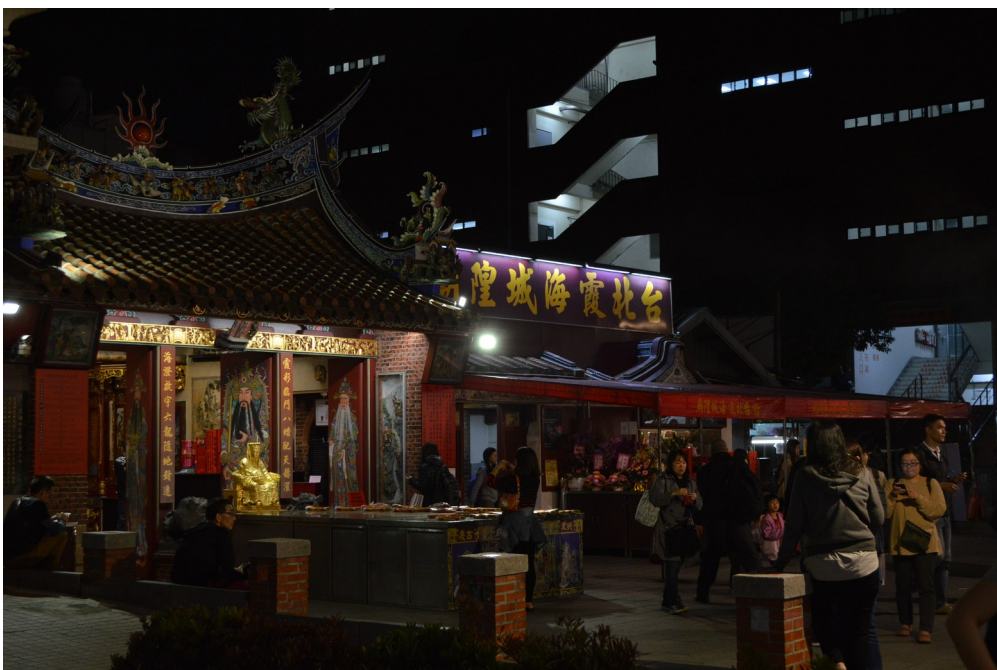
「霞海城隍廟」之建築，雖被壓制在四周的高樓之下，香火依然鼎盛。

漫步洋樓夾道的迪化街道上尋找可吃晚餐的地方，感覺大稻埕的街景迥異於台北其他地區隨處可見的街景。從美國住了幾十年的地方來到台北，我感受最深刻的，除了大眾交通系統很