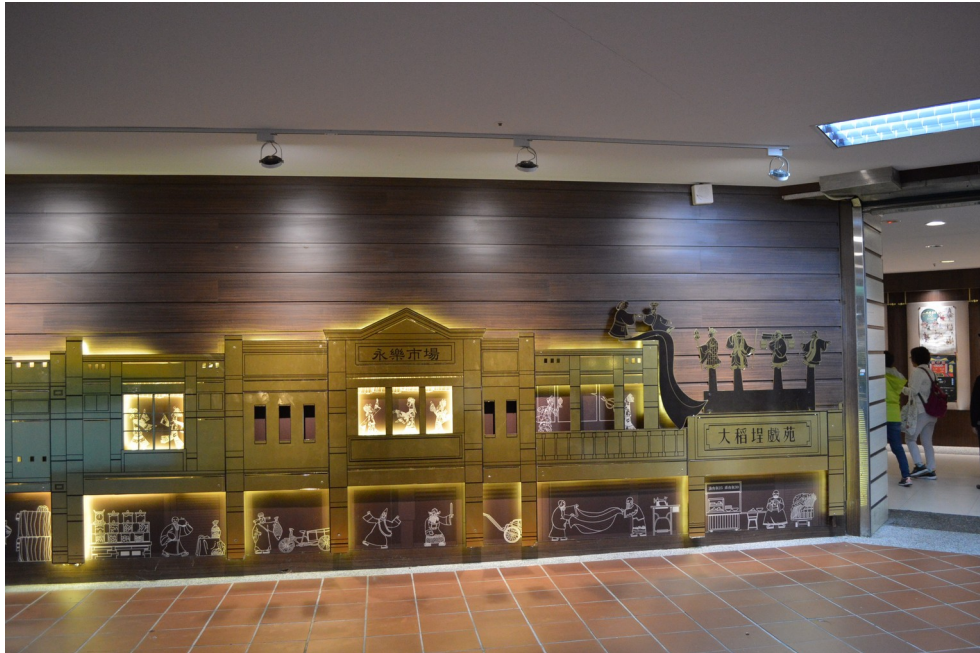
座落在九層大樓裡的「大稻埕戲苑」

木偶、服裝與道具的展示廳，演廳在九樓。當夜有一歌仔戲演出，票價平均在千元以上；想起小時候在城隍廟外，擠在人堆裡免費看野台戲的情景，花一千元看可能聽不懂的戲，算了罷。