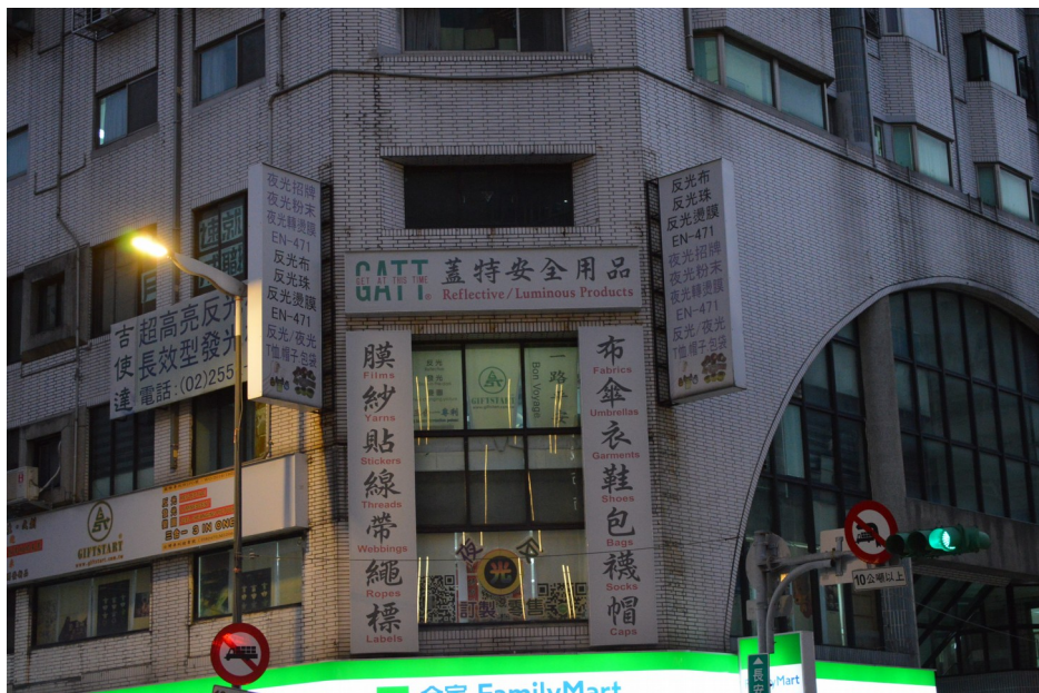
走進迪化街即見一像對聯樣的商號店面

走出捷運北門站三號出口，過了市民大道，就是進大稻埕迪化街的「門戶」-- 塔城街。心裡默念著「大稻埕、迪化街、塔城街」三個街名，感覺是混合了台灣味與新疆味的名稱。走沒多久，瞥見一大樓門口的騎樓兩側，「書」 註2 有一幅對聯，顯然是標示商店貨品的內容(右聯--布傘表鞋包襪帽；左聯--膜紗貼線帶繩標)，其中有可以望文生義的商品名，也有看不懂是什麼「碗糕」的商品名；把視線移到「對聯」上方的「橫匾」處，寫的是【、、、蓋特安全用品】，還是不能一目了然是什麼樣的商店？雖然已經引起我們想一探裡面做的是什麼生意的濃濃好奇心，可惜，屋內昏暗的燈光表示已經打烊了。像這樣把商號標示在牆上而不是另作向外吊掛的招牌看板，在台北或台灣的商街是極少見的。推想，將商號標示在建築物的門牆上可能與清末年代，有歐美洋人在此建立貿易商號有關。這一帶是台灣保留較完整的老洋樓街廓，也因此為台北市留下了較多古色洋味的觀光資產。