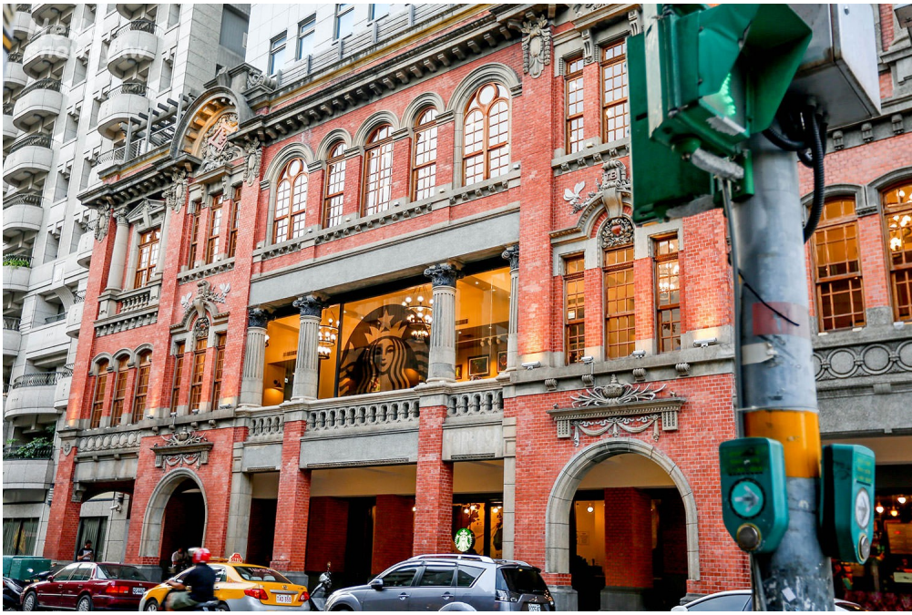
嘉利行（迪化街 185 號）與亞冀科技（183 號，歷史建築）