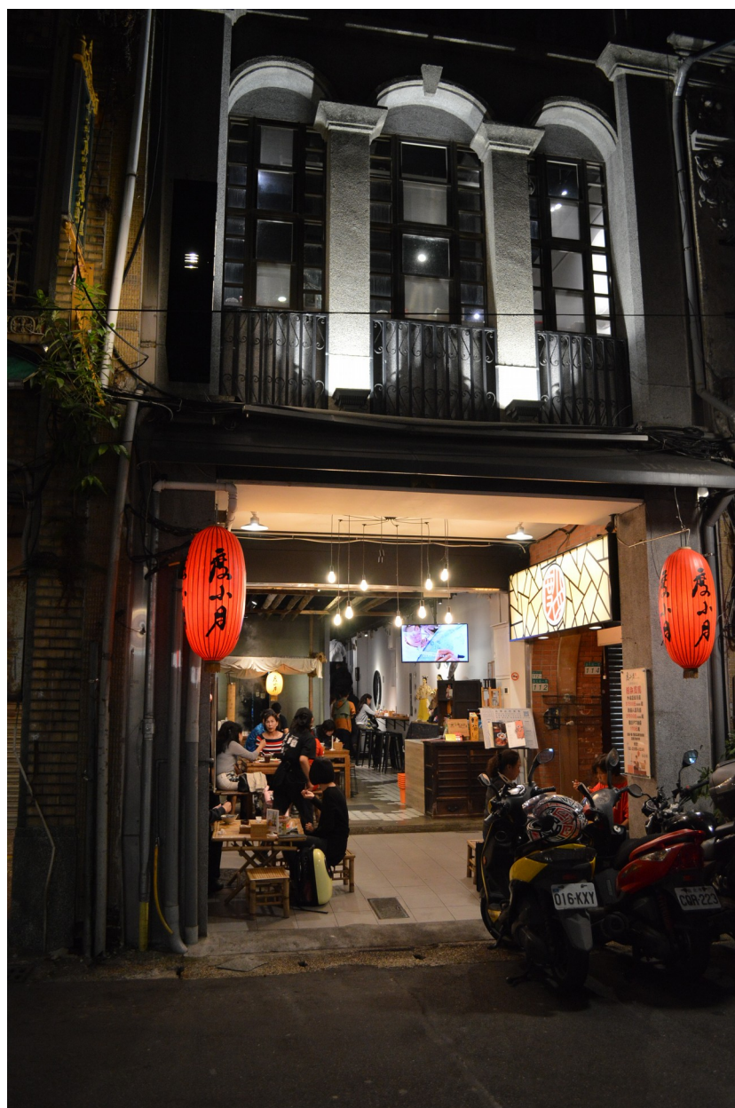
吊掛著橘色燈籠與低矮的煮麵攤是〈度小月〉的典型 Logo

話扯遠了，且回大稻埕內的迪化街，在這裡，台北街頭容易見到的每隔二、三、四間就有一吃食店的街景，變成每隔二、三、四間就有一賣南北貨或中藥店的街景。走過小時候跟著大人買年貨必然見到的城隍廟後不遠，突然眼睛一亮，見到某店面騎樓下兩側掛著熟悉的〈度小月〉招牌燈籠，來到傳統老街吃應景的傳統餐食正好。