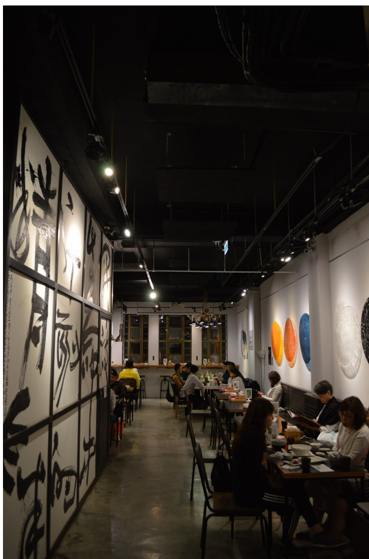
不再是路邊攤的迪化街〈度小月〉二樓一景

我們點了兩人份量的擔仔麵、肉燥飯、滷貢丸、芙蓉蛋豆腐、黃金蝦捲，花了605元，折合美金約20元。比起在住家巷弄內同樣份量的小吃，大概是三倍價錢，但就美國的標準來說，還算是小吃的花費罷！