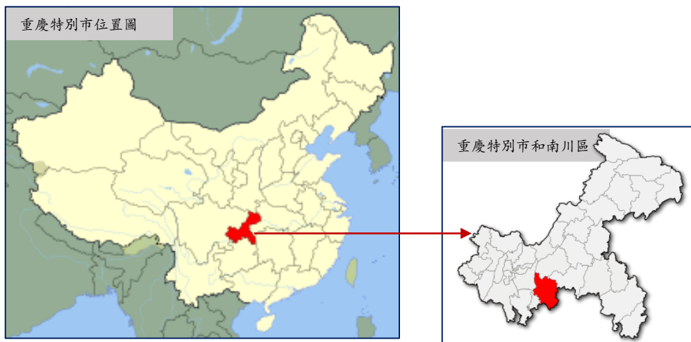
圖一 重慶特別市及南川區

南川位於四川省東南隅，北接昔重慶市，南鄰貴州省，自唐朝貞觀十一年（公元631）起就設置為縣。1997年政府將重慶市和其附近的20多個縣市合併而成為擁有3000多萬人口的川重慶特別市。從此，四川省南川縣改稱重慶市南川區（圖一）。